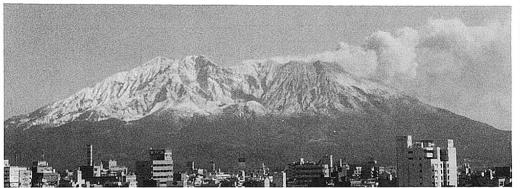
同窓会設立総会の朝、桜島は5合目まで新雪に覆われた

ましよう。とは申しませんが、これからの正念場であります。二十一世紀の大学教育が云々されている現在、私たちの同窓会の在り方も真剣に模索していかなければならないのではないかと思っています。同窓会は発足したばかりで、この運営にはかなり汗と知恵を出さなければならぬと覚悟致しております。所帯が大きいだけに、運営その他難しい面も多々あるかと思われま